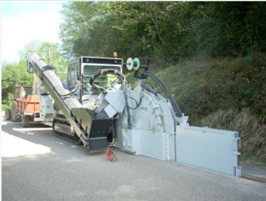
トレンチャー掘削の様子