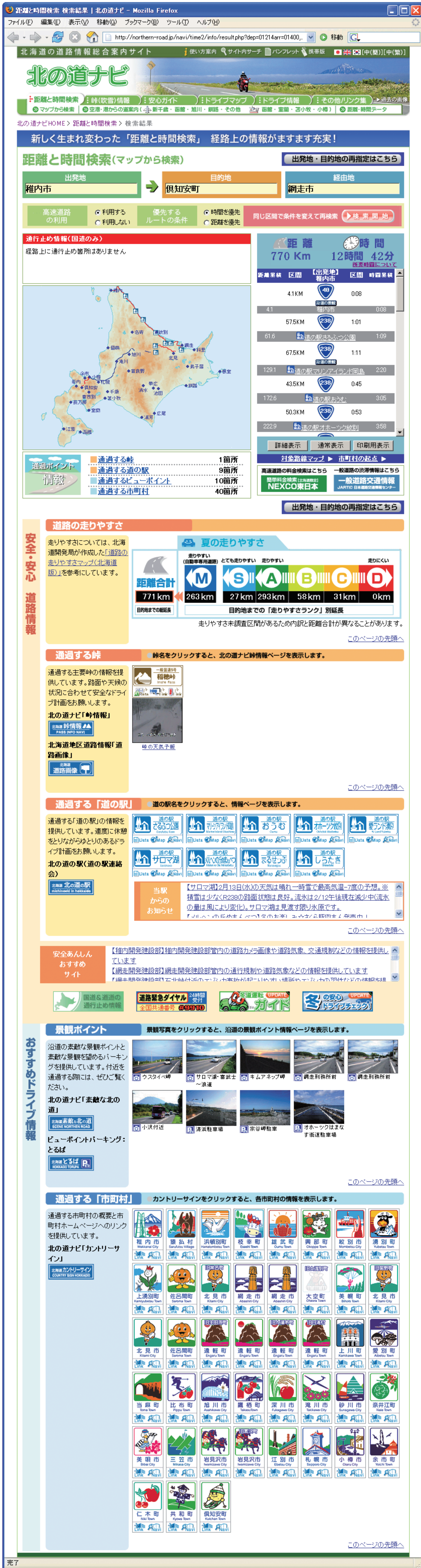
▲図-2 「距離と時間検索」の検索結果 Figure 2. Result of time and distance search