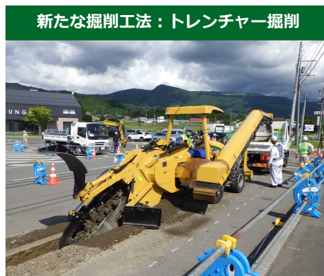
▲トレンチャー掘削の状況 (R3.9.2)

欧米諸国で使われるトレンチャー掘削機の国内現場での適用に向け、これまで寒地土木研究所において取り組んできた技術開発を踏まえ、北海道内の電線共同溝工事に初めて導入しました。